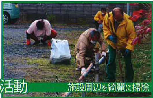
施設周辺を綺麗に掃除