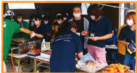
共生の森と結の郷わくや合同で秋祭りを行いました